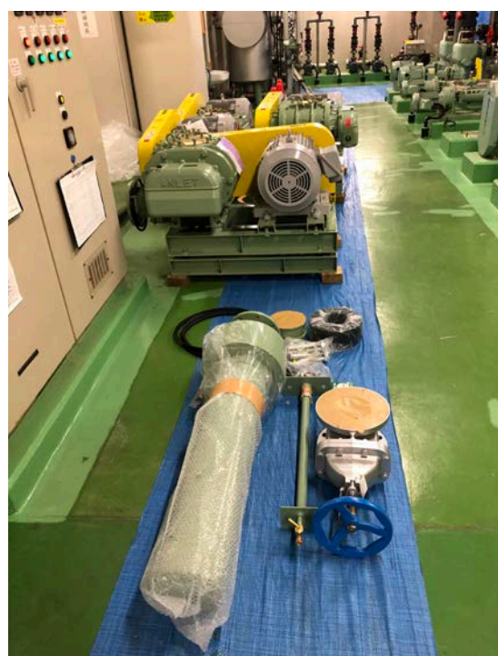
流動床・貯留槽ブロワ納入②(R2. 6. 27)