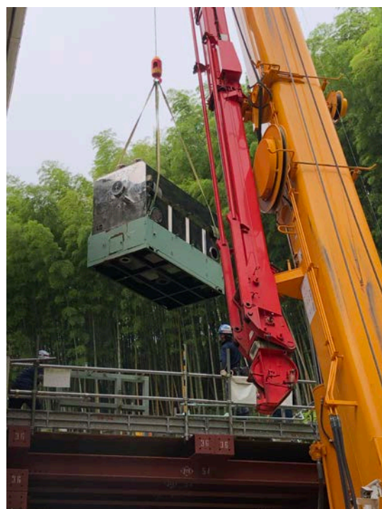
既設前処理設備撤去②(R2. 6. 6)