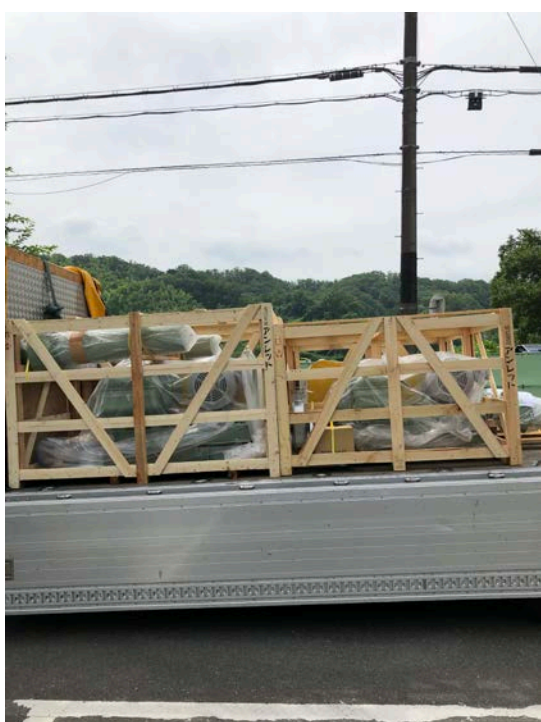
流動床・貯留槽ブロワ納入①(R2. 6. 27)