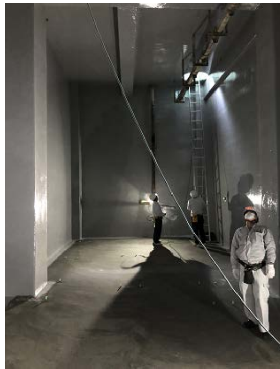
防食塗膜工事上塗り検査②(R2. 9. 10)