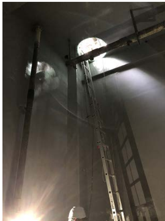
防食塗膜工事上塗り検査①(R2. 9. 10)