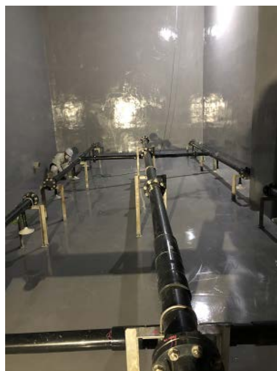
防食塗膜工事完成検査②(R2. 9. 25)