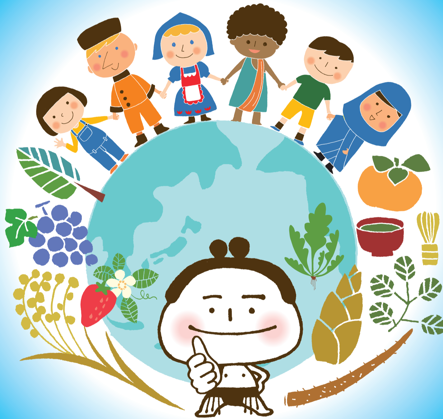
相案消費生活センター のキャラクター がまろ山