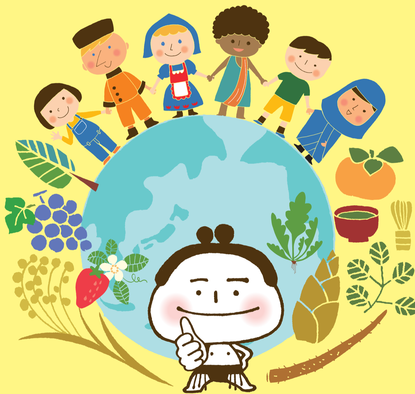
相案消費生活センターのキャラクター がま口山