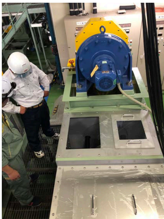
脱水設備試運転(R2. 5. 11～)