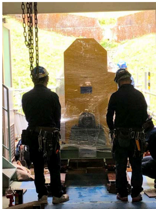
脱水設備納入②(R2. 5. 4)