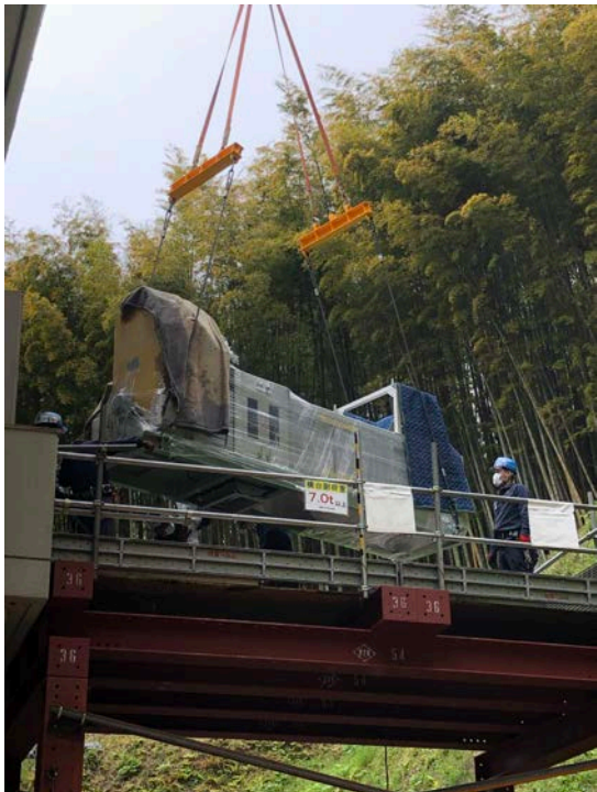
脱水設備納入①(R2. 5. 4)