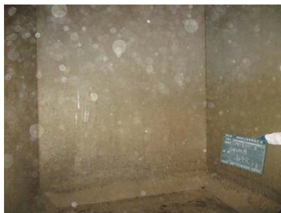
調整槽改良工事④(R3. 2. 16)