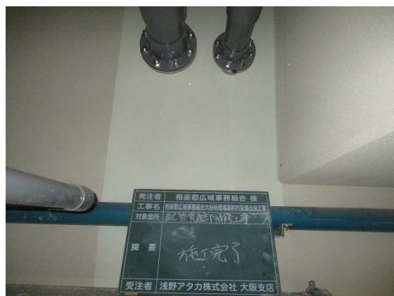
し尿貯留槽漏水補修工事②(R3. 2. 18)