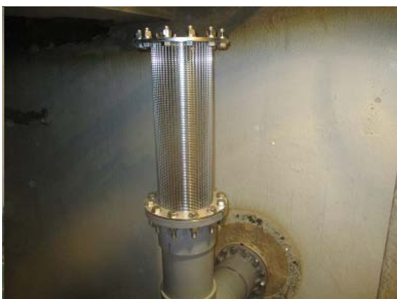
調整槽改良工事③(R3. 2. 16)