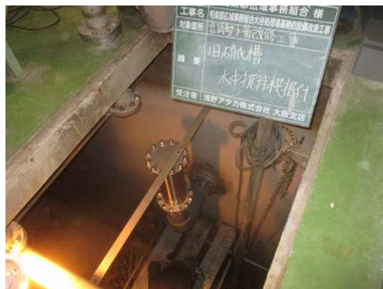
調整槽改良工事②(R3. 2. 16)