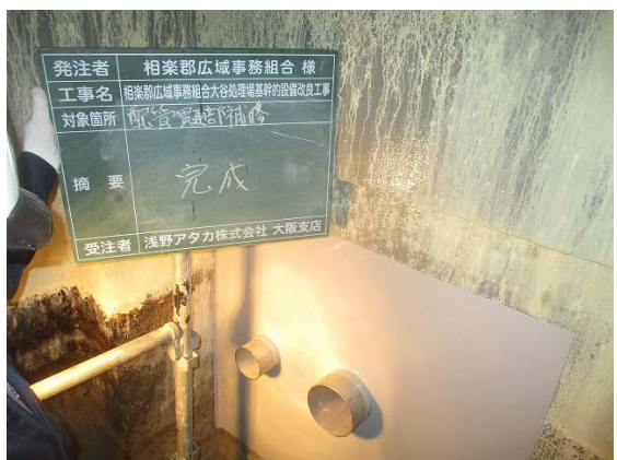
し尿貯留槽漏水補修工事①(R3. 2. 18)