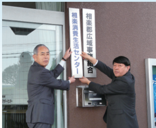
▲相楽消費生活センター開所式（平成22年3月1日）

そんなとき、「こんなことを聞いても…」や「しかたないわ…」などと、一人で悩まないで、お気軽にご相談ください。