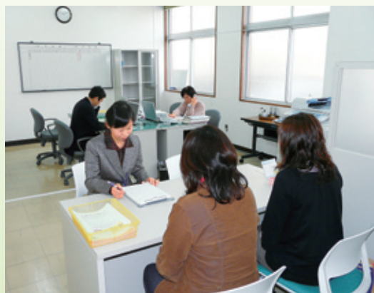
▲相楽消費生活センター