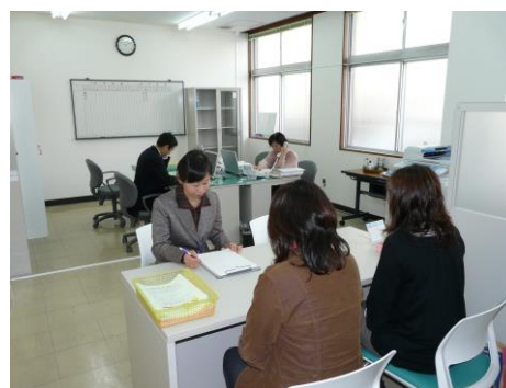
▲相楽消費生活センター